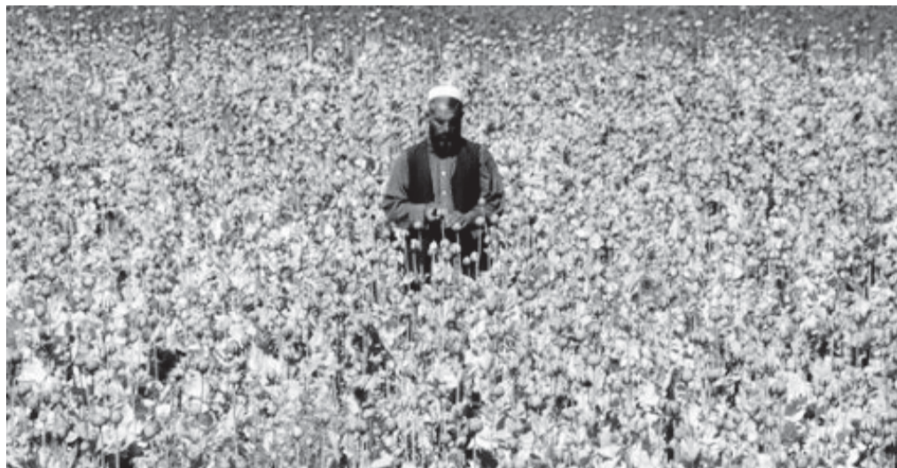
Опийные плантации. Лишь одна провинция Гильменд производит наркотиков больше, чем вся Колумбия

В 2007 г. в Афганистане выращен самый крупный урожай опия за всю историю страны. Согласно данным Управления ООН по наркотикам и преступности (UNODC), в прошлом году афганские земледельцы собрали 8.200 тонн опия-сырца. Это на 17% больше урожая 2006 года, когда было собрано 6.100 тонн. Впечатляют темпы роста производства наркотиков. К примеру, в 1997 году было выработано 2.800 тонн опия, а под посевами мака находилось 58.000 га. В минувшем году посевные площади под мак заняли 193.000 га. В производственный процесс по выращиванию этой культуры было вовлечено около двух миллионов крестьян.