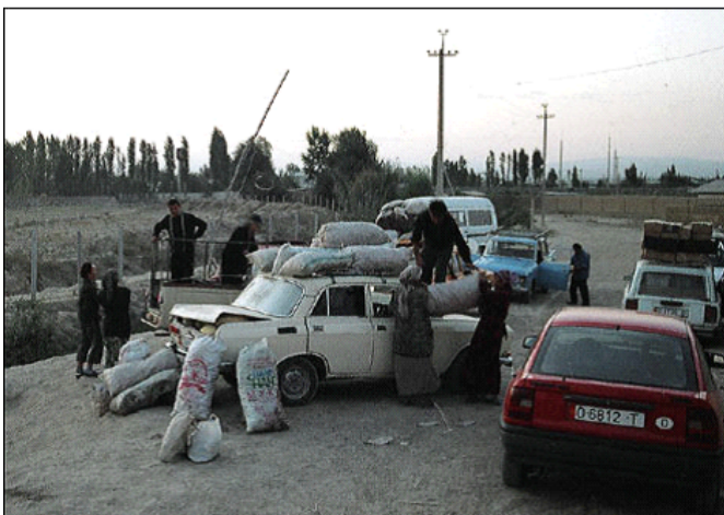
Продавцы из Узбекистана привезли овощи на кыргызскую территорию