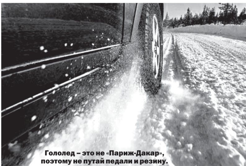
Гололед - это не «Париж-Дакар», поэтому не путай педали и резину.

Если же посмотреть на рисунок протектора, то и он отличается кардинально, ввиду разных задач, на него возлагаемых. Летние шины - управляемость на сухом и мокром асфальте. Зимние шины - стойкость к заносу, управляемость и тормозные свойства на снегу и льду. Очевидно,