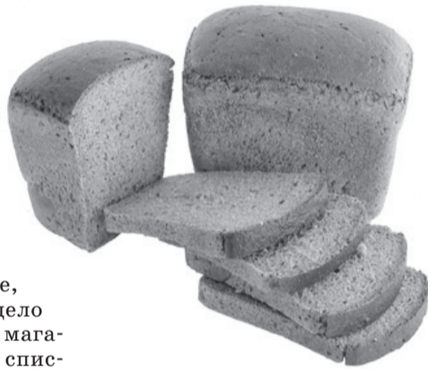
ку нормы ее завоза в магазины очень ограничены.

Аналогичная ситуация сложилась и с обеспечением муки по фиксированным ценам. С нового года нормы отпуска такой муки уменьшились с 6 до 4 кг на человека. В очередь на ее приобретение записываются заранее, и трехзначные номера - дело привычное. Приходить к магазину, чтобы отметить в списке, приходится по несколько дней, что, впрочем, не гарантирует получения муки, поскольку