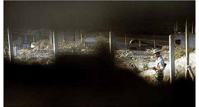
«Коммерсанты» подматривают в щель в заборе, когда солдат уйдет или даст команду проходить...

"Большие чиновники беспрепятственно через таможенные посты на больших машинах перевозят китайские грузы, которые затем открыто продаются в больших магазинах. А мы вынуждены прятаться, потому что при задержании, кроме изъятия товара, еще наложат большой штраф.