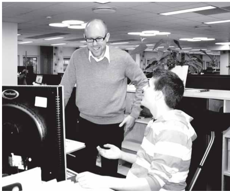
Сидя у своих компьютеров, инженеры Ларсоны подсчитали, что Санта Клаус должен жить в Каракулже.

- Я полагаю, что внутри меня есть работничка детства. Как у всех работников рекламного бизнеса.