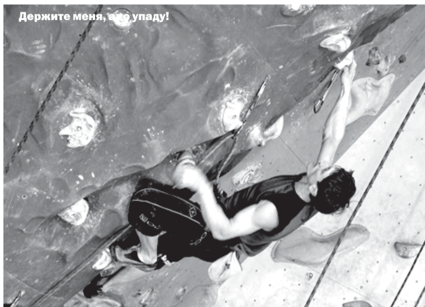
Держите меня, это упаду!