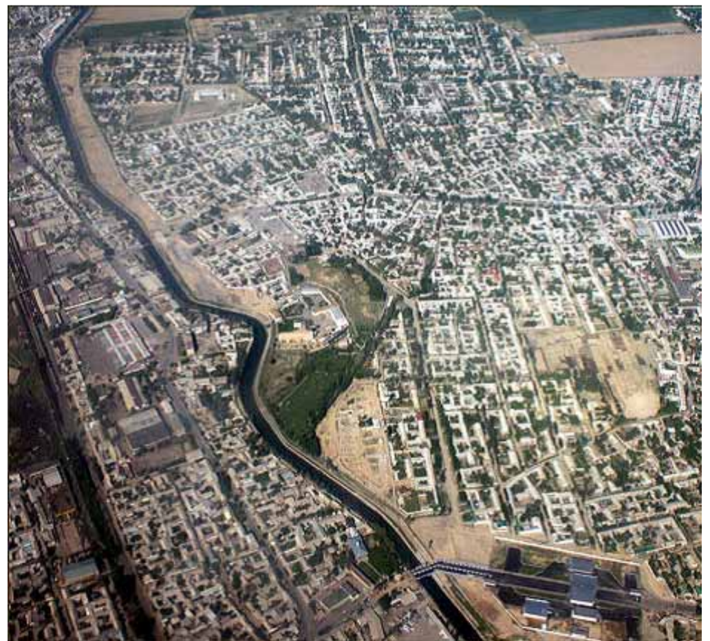
Город Карасуу на узбекско-кыргызской границе. с самолета. Весна 2007 г. Справа — территория Узбекистана. Видна приграничная полоса, освобожденная от построек. В правом нижнем углу — новый таможенный терминал, построенный в 2007 году