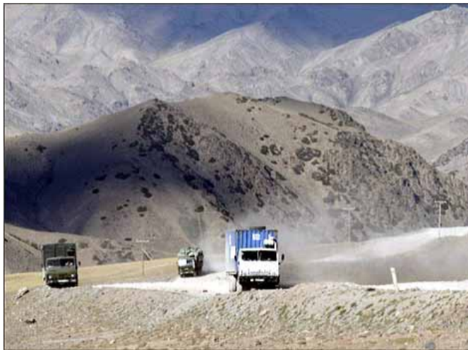
Великий Шелковый путь сегодня: КАМАЗы вместо караванов верблюдов...

Древний караванный путь, который назывался "Великим шелковым", сохранился. Изменились только способы доставки товаров: караваны верблюдов заменили колонны большегрузных машин. Вместо разбойников, которые взымали дань с купцов, теперь появились ведомственные посты, которые вполне официально берут мзду за провоз. Как раньше товары Великого Шелкового пути расходились по всему Евразийскому миру, не зная границ и преград, так и сейчас, несмотря на искусственно созданные препятствия, колючую проволоку и угрозы быть избитыми солдатами, торговцы, которые теперь называются более модным словом "коммерсант", развозят товары по пути, который когда-то действительно был Великим.