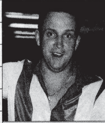
Лидер группы "Дюна"