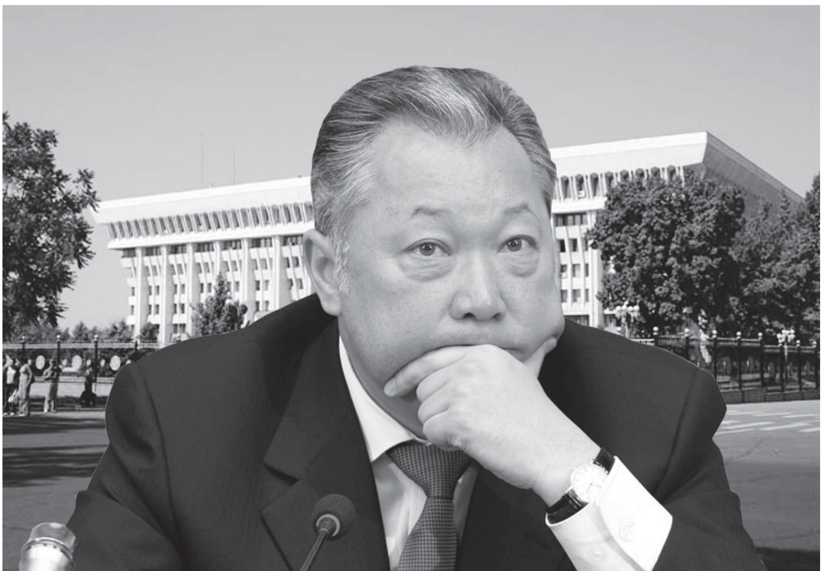
Как ты тяжела, "шапка Мономаха"...

И тем не менее, "первой ласточкой", сообщившей о надвигающихся переменах в стране, стали слухи о досрочных президентских выборах. Более того, аналитики не исключают версию и о скором внедрении "молдавской модели" демократии (это когда Президента выбирает не народ, а парламент страны). А наиболее легкодоступным средством им видит-